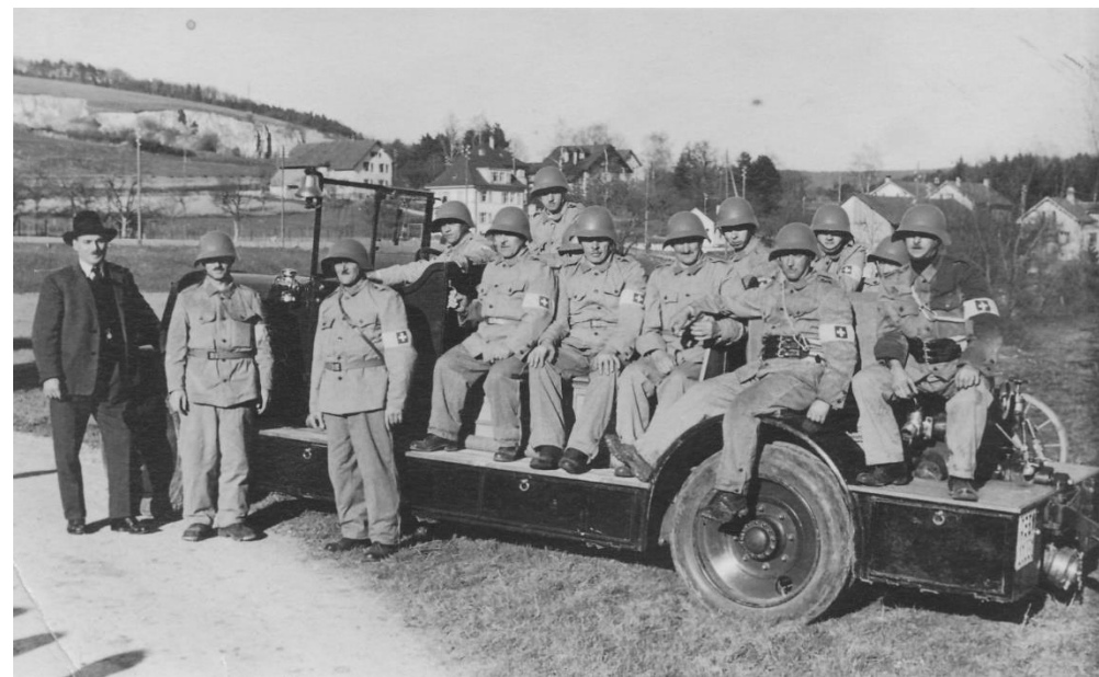
Die Kriegsfeuerwehr bei einer Übung an der Birs (beim heutigen Kinderspielplatz bei der Naubrücke).