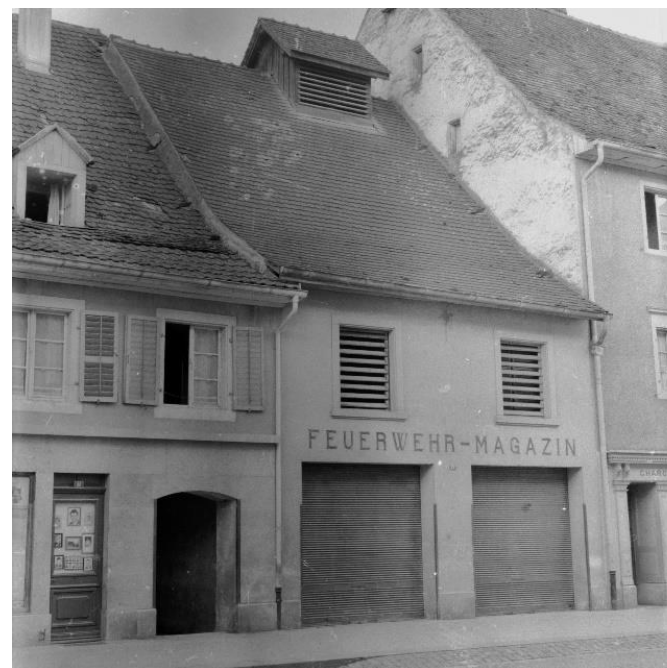
Umzug vom alten Magazin im Stedtli ins neue Magazin an der Amthausgasse