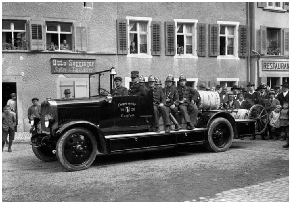
Die Automobilspritze SAURER wird 1926 feierlich auf dem Rathausplatz an die Feuerwehr Laufen übergeben

Im alten Gemeindeversammlungsprotokoll vom 25. Juni 1925 ist festgehalten, wie der damalige Präsident der Feuerwehrkommission die Vorteile dieser Automobilspritze betonte. Neben der besseren Löschleistung erwähnte er auch, dass ein Mann die Spritze allein bedienen könnte. Mit der Laufspritze waren 25 Mann notwendig, das war bei einem damaligen Feuerwehrbestand von rund 150 Mann ein Sechstel der Mannschaft. Nach eingehender Diskussion wurde also die Anschaffung zu einem stolzen Preis von Fr. 32'000.-- beschlossen. Nach Abzug der Subventionen blieben der Gemeinde Laufen Restkosten von knapp Fr. 6'000.--, das Budget für das Feuerwehrwesen betrug in dieser Zeit übrigens Fr. 1'000.—pro Jahr.